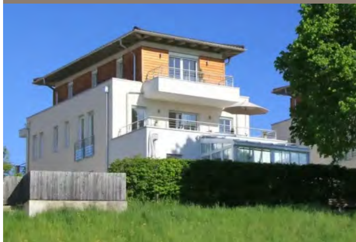
VERKAUF Freilassing - Penthouse