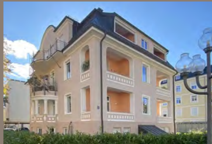
VERKAUF Bad Reichenhall - Eigentumswohnung in Altbauvilla