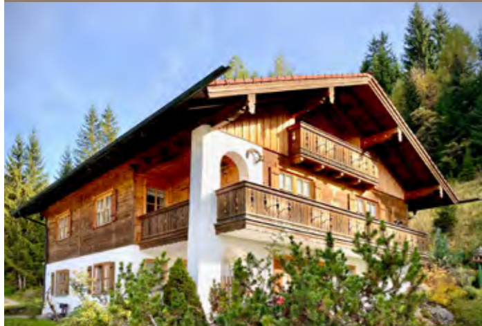
VERKAUF Berchtesgaden - Mehrfamilienhaus

In den vergangenen Jahren haben wir eine Vielzahl an Immobilien erfolgreich verkauft - von klassischen Wohnungen und Penthäusern, über Einfamilien- und Mehrfamilienhäuser im Bestand, bis hin zu Neubauimmobilien für Bauträger.