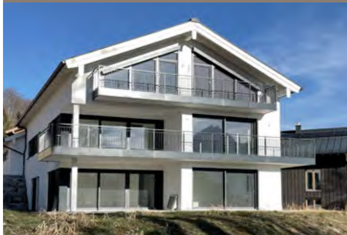
VERKAUF Berchtesgaden - Eigentumswohnungen

In den vergangenen Jahren haben wir eine Vielzahl an Immobilien erfolgreich verkauft - von klassischen Wohnungen und Penthäusern, über Einfamilien- und Mehrfamilienhäuser im Bestand, bis hin zu Neubauimmobilien für Bauträger.