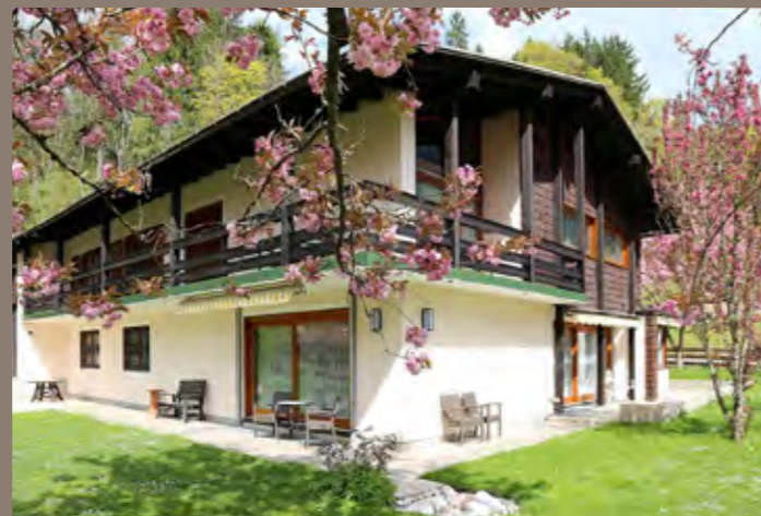
VERKAUF Schönau am Königssee - Wohn- und Geschäftshaus